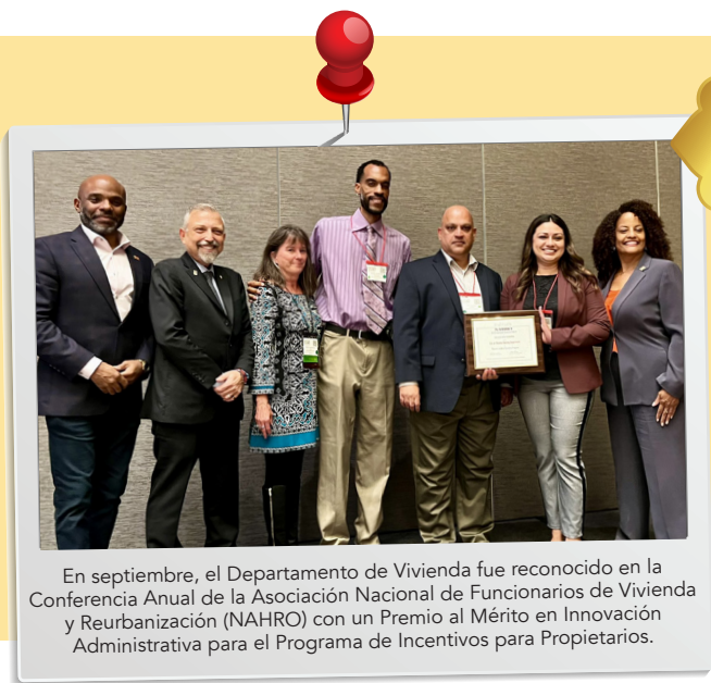
En septiembre, el Departamento de Vivienda fue reconocido en la Conferencia Anual de la Asociación Nacional de Funcionarios de Vivienda y Reurbanización (NAHRO) con un Premio al Mérito en Innovación Administrativa para el Programa de Incentivos para Propietarios.