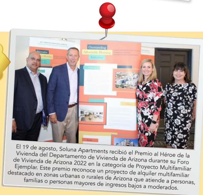
El 19 de agosto, Soluna Apartments recibió el Premio al Héroe de la Vivienda del Departamento de Vivienda de Arizona durante su Foro de Vivienda de Arizona 2022 en la categoría de Proyecto Multifamiliar Ejemplar. Este premio reconoce un proyecto de alquiler multifamiliar destacado en zonas urbanas o rurales de Arizona que atiende a personas, familias o personas mayores de ingresos bajos a moderados.